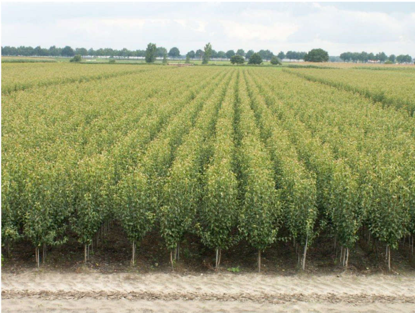
Сила роста подвоев

В Европе, 80% груши привито на подвое Айва С который относится к виду Айва Продолговатая (лат. Cydonia oblonga ). Более старые подвои это Айва А и Айва Адамс. Преимущества подвоя Айва С – это карликовость и высокая урожайность, но, к сожалению, этот подвой имеет низкую морозостойкость. В связи с этим питомник Fleuren начал заниматься выведением нового морозостойкого подвоя. После 15 лет селекционной работы был выведен подвой Айва Элин. Айва Элин имеет очень хорошую приживаемость всех сортов груши, высокую урожайность, сила роста такая же как у Айвы С, при этом плоды груши крупнее и имеют более гладкую поверхность. Айва Элин имеет высокую морозостойкость и хорошо переносит жару. Мы ожидаем, что в ближайшем будущем, в Европе, этот подвой полностью заменит Айву С. В Италии уже используют этот подвой, в связи с жарким климатом, в США используют Айву Элин из-за низких температур зимой и высоких летом. Айва Элин является идеальным подвоем для стран с холодными зимами.